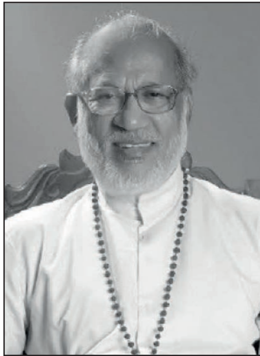
His Excellency Mar George Alencherry (Major Arch Bishop of Ernakulam - Angamaly)