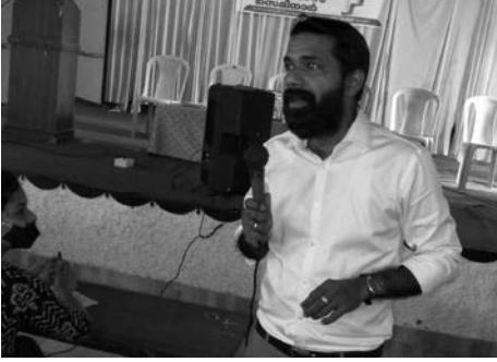
WOMEN CELL INAUGURATION