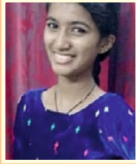
Gadha Radhakrishnan Kavitha Parayanam Light Music Female A Grade