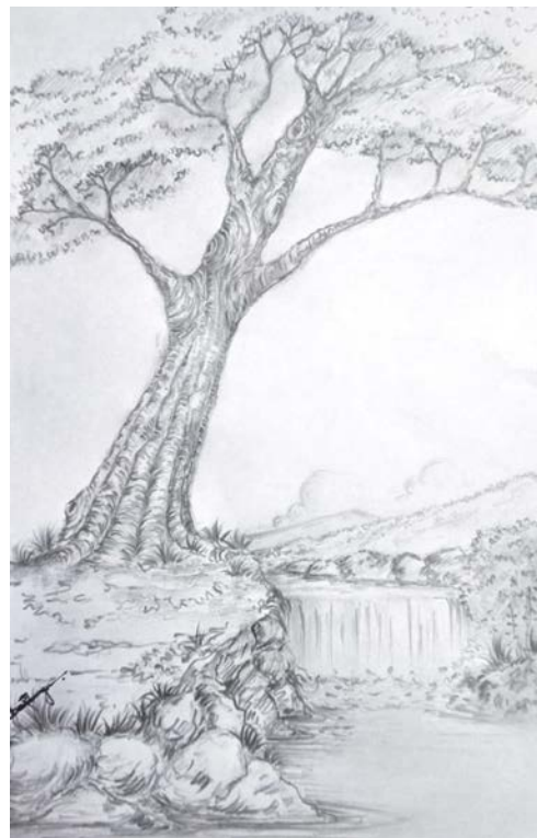
Daya B.A Economics