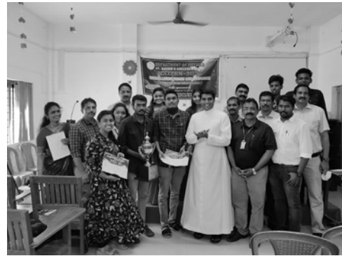
CHRISTMAS CELEBRATION & FRESHERS DAY