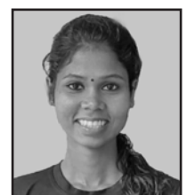
വർഷ 2nd B.A Political Science

“പകയില്ലെനിക്ക് ... പകരം വീട്ടാൻ മാത്രം അത്ര ക്രൂരയല്ലല്ലോ ഞാൻ..